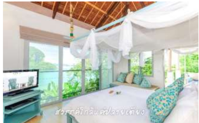
สวีตสวีต/โลคัล/ลวงเตียง