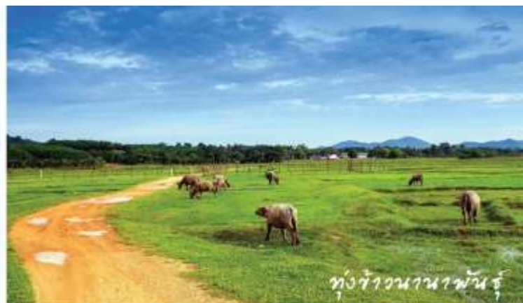
ทุ่งข้าวนาพานันรุ