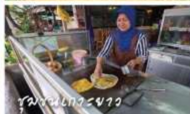
ชุมชนเกาะยาว