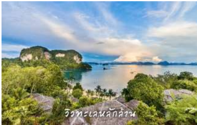
วิวทะเลน้กล้วน