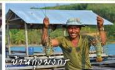
บ้านกิ่งพังก